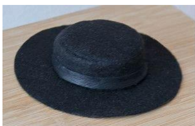
Шляпа с широкими полями Размер МСД