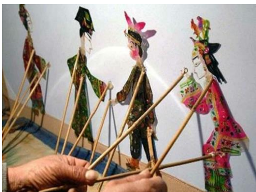
кукловод за ширмой

Подобные представления многим пришлись по вкусу и театр теней очень быстро стал распространяться по всем провинциям Китая. Правда, первые упоминания о них возникли лишь во время правления династии Сун. В те годы теневые кукловоды уже начали образовывать собственные гильдии и путешествовать со своими мини-спектаклями по стране.